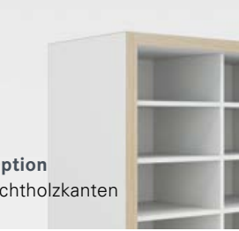
Option Echtholz kanten