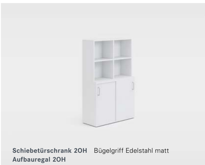
Schiebetürschrank 20H Bügelgriff Edelstahl matt Aufbauregal 20H