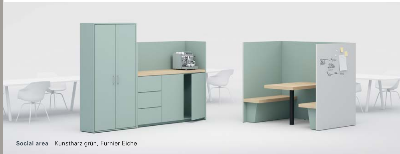
Social area Kunstharz grün, Furnier Eiche