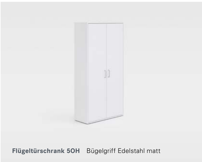
Flügeltürschrank 50H Bügelgriff Edelstahl matt