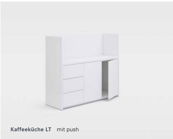
Kaffeeküche LT mit push