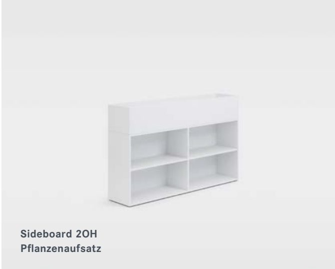
Sideboard 20H Pflanzenaufsatz