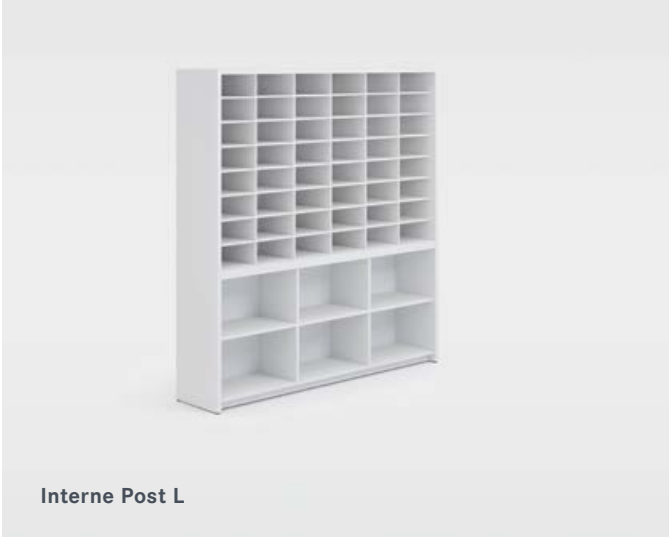
Interne Post L