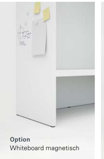
Option Whiteboard magnetisch