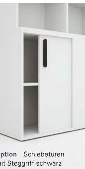
Option Schiebetüren mit Steggriff schwarz