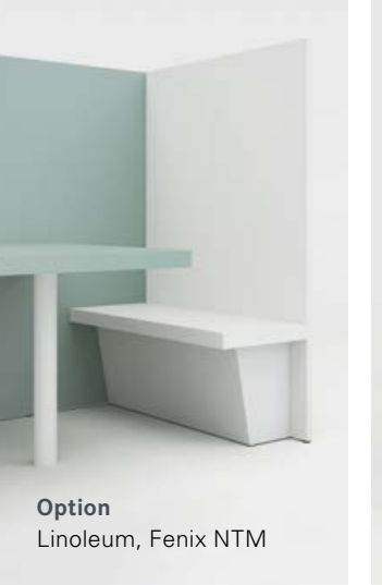
Option Linoleum, Fenix NTM