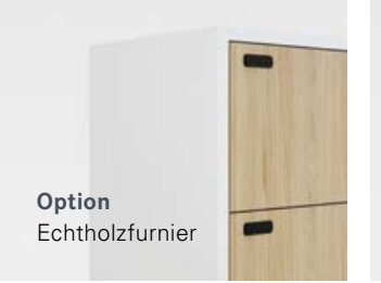
Option Echtholz furnier

Standard 2 Kunstharz hellgrau NCS S 1500-N