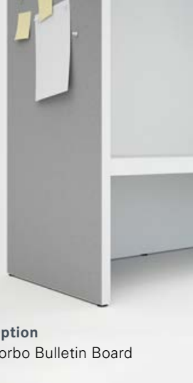
Option Forbo Bulletin Board