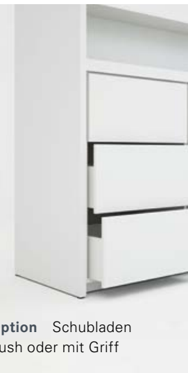
Option Schubladen push oder mit Griff