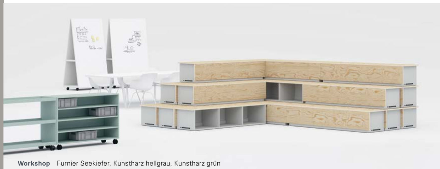
Workshop Furnier Seekiefer, Kunstharz hellgrau, Kunstharz grün