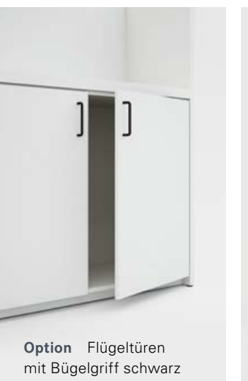
Option Flügeltüren mit Bügelgriff schwarz