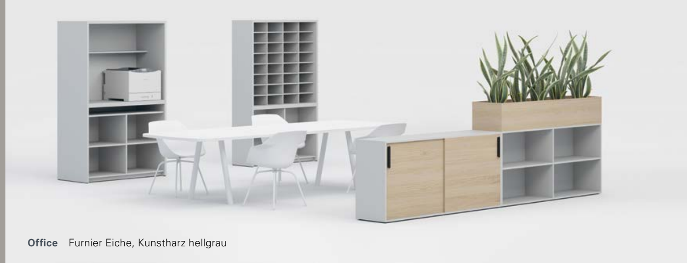
Office Furnier Eiche, Kunstharz hellgrau