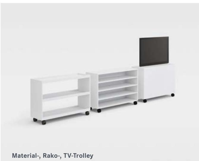
Material-, Rako-, TV-Trolley