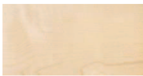
Ahorn natur Aufbau