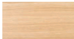
Eiche matt lackiert Aufbau