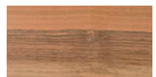
Nussbaum europäisch natur Aufbau