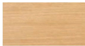
Eiche natur Schlicht