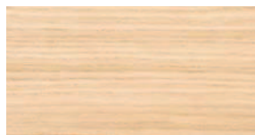
Eiche weisslich gebeizt Schlicht