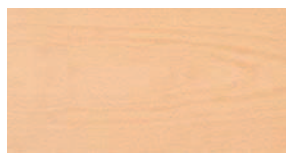
Buche natur Aufbau