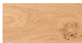
Asteiche matt lackiert Aufbau