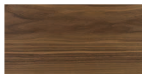
Nussbaum amerikanisch natur Aufbau