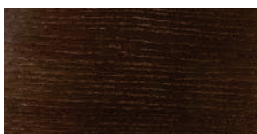
Eiche thermo dunkelbraun , Schlicht