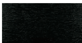
Eiche Schwarz lasiert Aufbau