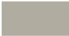
Linoleum pebble 4175