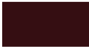
Linoleum burgundy 4154