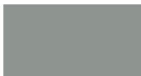
Linoleum ash 4132