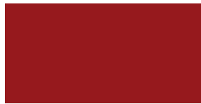
Linoleum salsa 4164