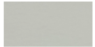
Linoleum vapour 4177